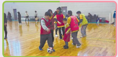
チャレンジスポーツコーナー