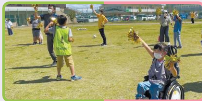
チアリーダーとのダンス体験