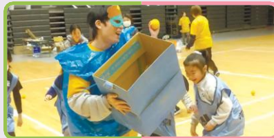
大学生によるレクリエーション