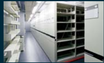
■ 書庫 1Fに一般書庫と保存書庫、2Fに雑誌書庫を設置し、今後の増書にも対応。