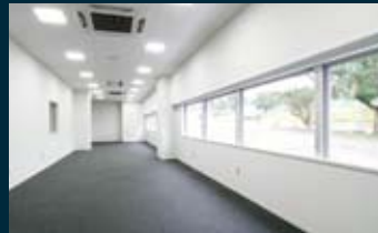
■ 学習室 明るく広々とした学習室は静寂に包まれ、学習に集中するのに最適な空間。