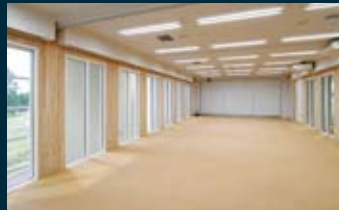
■ セミナールーム 大型ルームの他、少人数用の小ルームも。利用目的に合わせて選択が可能。