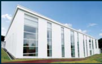
■ 外観 白を基調とし、周囲の自然との調和を重視したモダンで美しいデザイン。