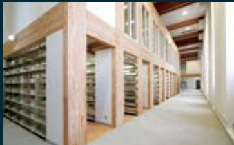
■ 書架 利用しやすさを追求。書架間も十分な幅で、車いすでも安心して利用可能。