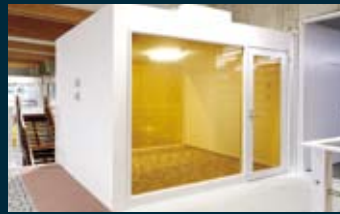
■ コラボックス 仕切られた空間は、討論も可能。鮮やかな彩りが、特徴的な空間を演出。