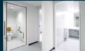
■ バリアフリーストイル 清潔感ある広々としたトイレはバリアフリー。障害者用トイレも各階に設置。