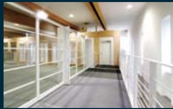
■ 学院展示 学院の創設からの歴史や史料を展示。尚綱学院の歩みなどを伝えていく。