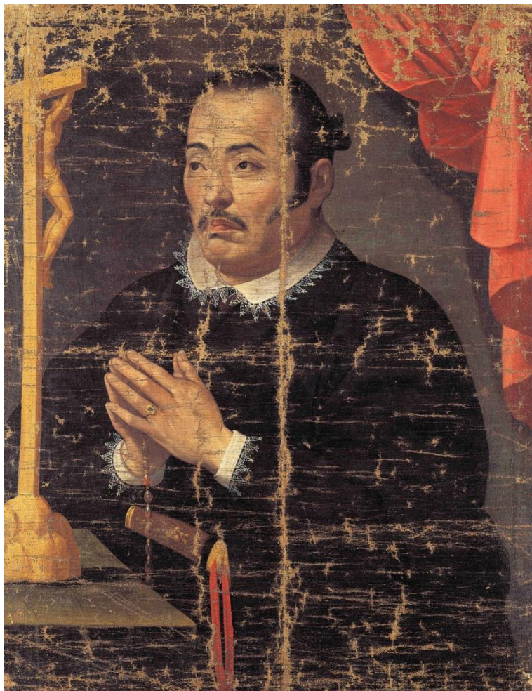
ユネスコ記憶遺産 国宝「支倉常長像」(仙台市博物館蔵)