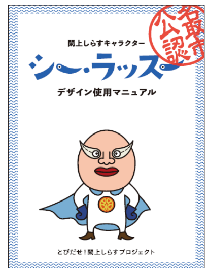
キャラクター使用マニュアル（2022）