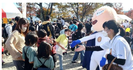
各イベントへの参加（2022）