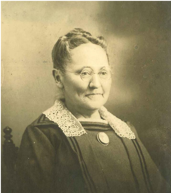
初代校長アニー・S・ブゼル