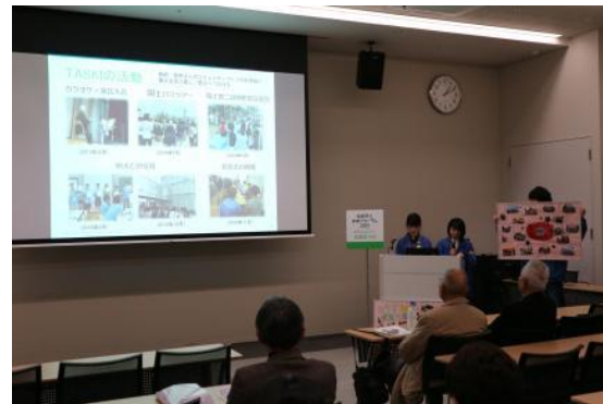
仙台防災未来フォーラム発表