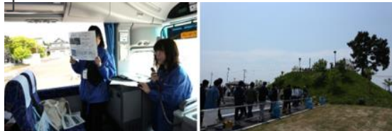
「大学間連携・春の閑上バスツアー」