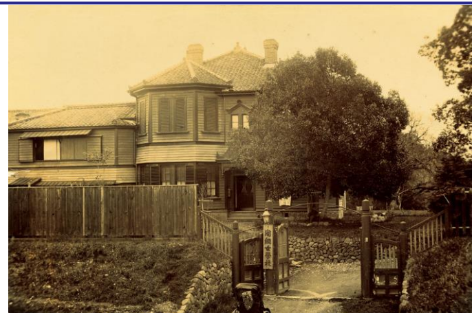
最初の校舎エラ・O・パトリックホーム

「キリスト教精神に基づく教育によって、 自己を深め、他者と共に生きる人間を育てる」