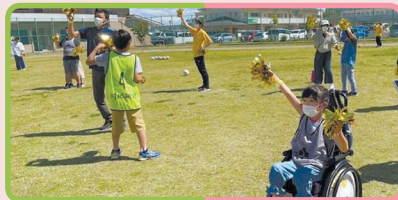
チアリーダーとのダンス体験