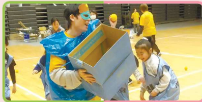
大学生によるレクリエーション