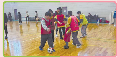
チャレンジスポーツコーナー