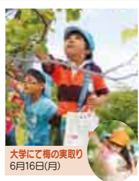
大学にて梅の実取り 6月16日（月）