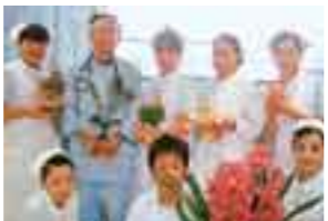
尚綱学院高等学校在学中は、3年間バスケットボール部に所属活躍。尚綱学院女子短期大学生活科学科・生活科学専攻被服科学コース入学・卒業。3年間のOL後、准看護学校、高等看護学校へて今春、正看護師としてはばたく。

1997年 尚綱学院高等学校 卒業 1999年 尚綱学院短期大学生活科学科 卒業 2007年 尚綱学院高等学校 卒業