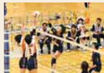
国 高校バレーボール選抜優勝大会宮城県大会(春高バレー)では、『高校・大学連携』によるチーム強化やコーチングキャラバンが身を結び、2年連続2度目の決勝進出を果たすことが出来たのです。