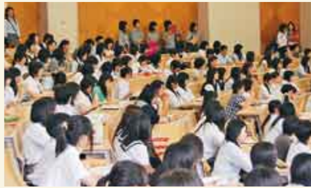
高校生に各学科の教育内容や魅力

約1,500名の方が参加していただきました 去る8月2日(土)、2008年度尚綱学院大学、同女子短期大学の「オープンキャンパス」を実施しました。今年のオープンキャンパスは、6月28日(土)、7月12日(土)のミニオープンキャンパスに続いて3回目、さらに9月27日(土)にもミニオープンキャンパスを実施します。