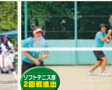
ソフトテニス部 2回戦進出