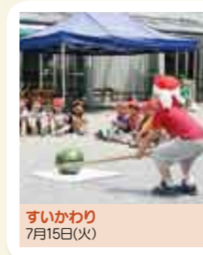
すいかわり 7月15日（火）