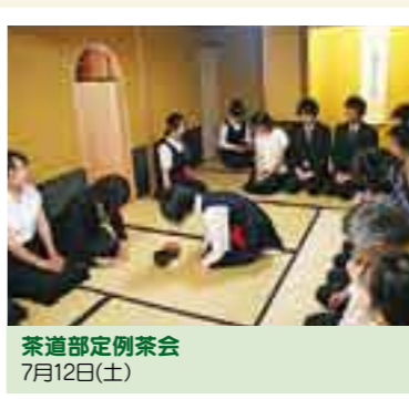
茶道部定期茶会 7月12日(土)