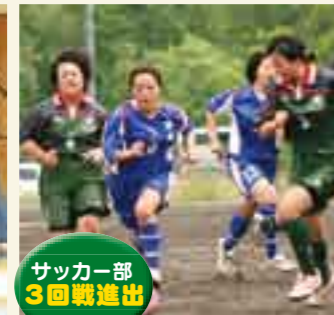
サッカー部 3回戦進出