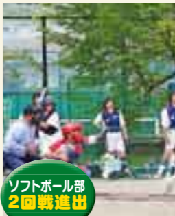
ソフトボール部 2回戦進出