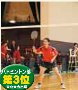
バドミントン部 第3位 東北大会出場