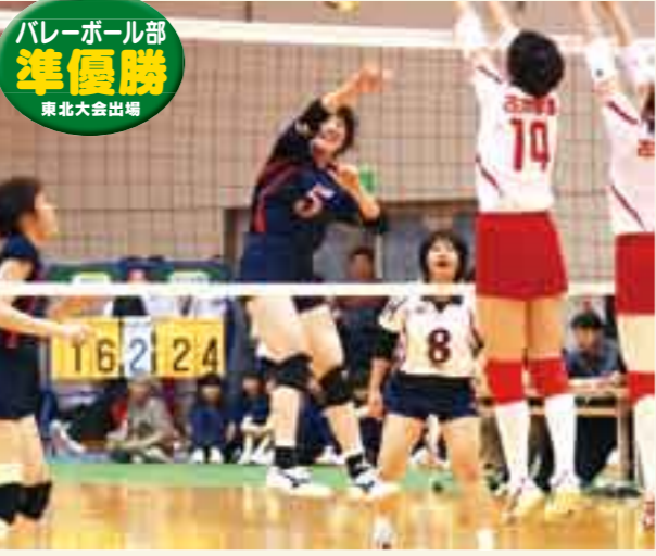
バレーボール部 準優勝 東北大会出場