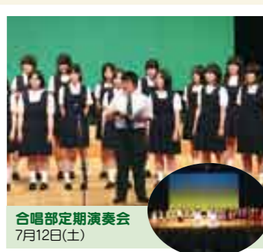
合唱部定期演奏会 7月12日(土)