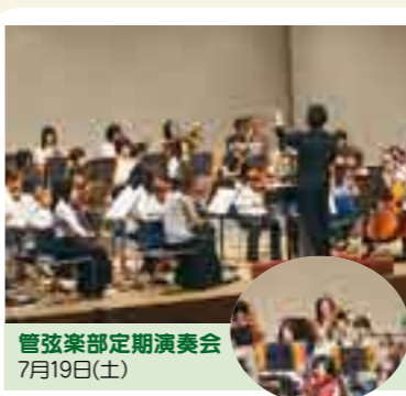
管弦楽部定期演奏会 7月19日(土)