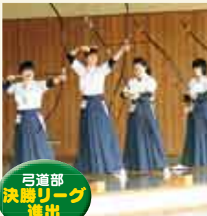
弓道部 決勝リーグ進出