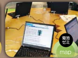
菊池ゼミ map 白石キーワードマップ 白石の名所・名物・そして有名人を、学生の視点から取材したもの(約46(しろ))のキーワードと、「14(いし)」のキーパーソンからなる電子ガイドマップとして製作。