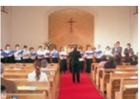
音楽教室を会場に活動しています。その他、同窓会行事での歌慰問演奏の活動も行っております。

「聖書と讃美歌を楽しむ会」として、奇数月の第二日曜日午前10時から11時半まで尚綱音楽教室を会場に活動しています。その他、同窓会行事での歌慰問演奏の活動も行っております。