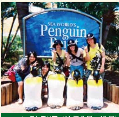
オーストラリア (11月9日~19日)

09年11月中旬、高校2年生は3方面に修学旅行を実施しました。平和について深く学びを深めたとともに、現在の我々の生活について考えさせられた沖縄、日韓両国の交流の歴史や文化を学び、釜山イサヘル高校生との楽しいひと時を持った韓国。また、10日間豪州ブリスベン市に滞在し、現地高校での授業、ホームステイなどを経験した国際情報クラスなど、それぞれ思い深い体験になりました。