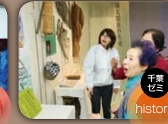
千葉ゼミ history 白石本郷まちなみミュージアム 3つの展示企画を開催。①白石市教育委員会の全面協力の下「最後の小十郎」という展示企画。②「わたしたちの孫太郎!!」という展示企画。③「白石本郷まちなみミュージアム」という展示企画。