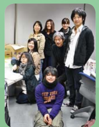
11月の本番では市の情報センター「アテナ」に編集室を設置し、ミニコミ紙を2回発行しました。OA機器や印刷用紙を配置した編集室での記念撮影です。