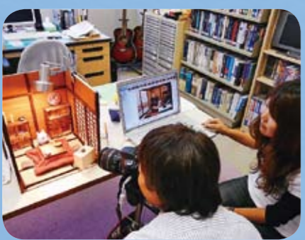
背景セットに粘土で制作した人形を置いて、少しずつ動かしながら撮影します。1秒間の動画に10枚以上の静止画が必要です。