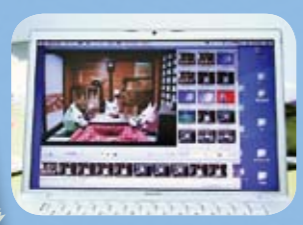
コマ撮りした画像と録音した声をパソコンに取り込んで編集します。

みんなの感想をきいてみよう! 庄ハツや携帯クリーナーなどの「ま〜このグッズ」がとんでも好評で、すぐになくなってしまいました。(学生A) ただアニメを見てもらうだけでなく、白石の皆さんといるいろいろなお話ができたのもとっても大きな収穫です。(学生B) プロの声優さんの熱演に押されて振り直しも大変でした。大変だったけど、よりいい作品になったと思います。(学生C)