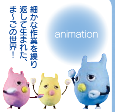
細かな作業を繰り返して生まれた、ま〜この世界!

みんなの感想をきいてみよう! 庄ハツや携帯クリーナーなどの「ま〜このグッズ」がとんでも好評で、すぐになくなってしまいました。(学生A) ただアニメを見てもらうだけでなく、白石の皆さんといるいろいろなお話ができたのもとっても大きな収穫です。(学生B) プロの声優さんの熱演に押されて振り直しも大変でした。大変だったけど、よりいい作品になったと思います。(学生C)