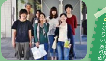
9月に調査と編集会議を兼ね、蔵王のリゾートホテルで2泊3日の合宿をしました。

みんなの感想をきいてみよう! 始まりは成功への不安から、次に楽しさや辛さがあり、最後は雑誌を手にとってくれた喜びを感じた長いよう短いお祭りでした。(S.K) 雑誌を発行するのは初めてで、戸惑うことも多くあった。時間がない中、完成したときには拍手をすくなく感動しました。(F.O) 何度か逃げ出したくなりましたが、終わってみると、楽しかった思い出が出てきません。忙しかった分、勉強になりました。(S.S)