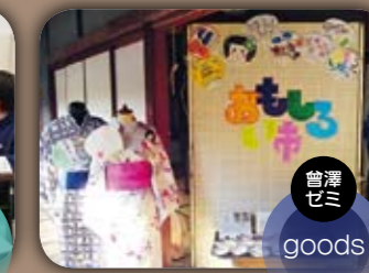
曾澤ゼミ goods おもしろい市 ゼミ生が考えた白石グッズの展示や、佐々木こけし工房さんとコラボレーションして制作したこけしハンガーの展示、そして「白石を感じる旅館の一室」を実際に再現したコーナーなどを展示。