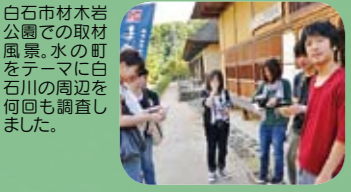
白石市材木岩公園での取材風景。水の町をテーマに白石川の周辺を何回も調査しました。