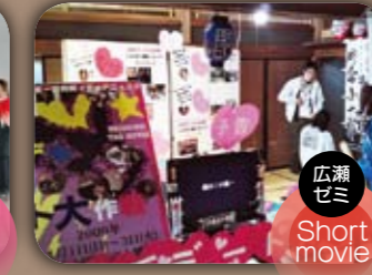
広瀬ゼミ Short movie 白石デート大作戦! 白石を舞台にして製作された青春ロードムービー「白石デート大作戦!」を上映。他に撮影が行われたロケ地情報や、白石ゆかりのグッズの展示。