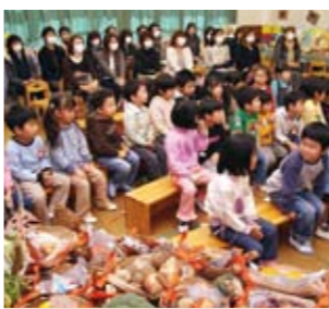
収穫感謝祭 11月12日(木)