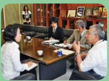
白石市長、風間康静氏へのインタビュー。白石の歴史と魅力を長時間お話し頂きました。