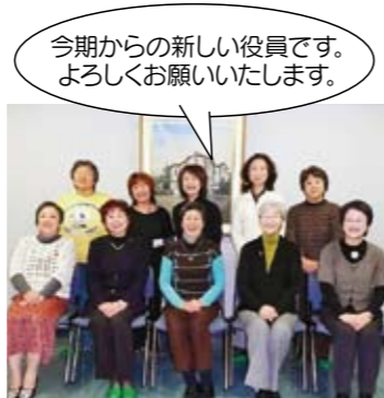
今期からの新しい役員です。よろしくお願いたします。

同窓会総会実行委員 スタッフ募集 今年5月15日(土)に行われます同窓会総会には、(寅)早生まれの元年生の方を中心に準備を進めておられます。実行委員としてご協力いただける方を募集しております。