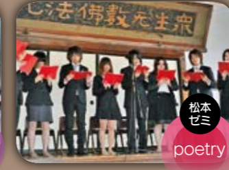
松本ゼミ poetry ことばで見る白石 白石市内の小中学生のみならずから募集した短歌や詩、白石に関する本などを、秋の白石を感じるような装飾と共に展示。他にゼミ生による詩や短歌、民話、そして白石をイメージして創られた詩の朗読・歌謡を行った。