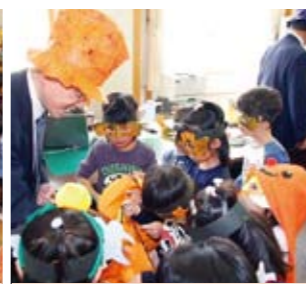
ハロウィン 10月30日(金)