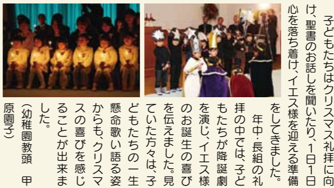
子どもたちはクリスマス礼拝に向け聖書のお話を聞いたり、1日1日心を落ち着け、イエス様を迎える準備をしてきました。年中・長組の礼拝の中では、子どもたちが降誕劇を演じ、イエス様のお誕生の喜びを伝えました。見ていた方々は、子どもたちの一生懸命歌い語る姿からも、クリスマスの喜びを感じることが出来ました。

幼稚園では12月15日(火)・16日(水)(年中・長組の縦割りペア)、17日(年少組)の3日間の日程で、保護者の方々やご家族の方々と共にクリスマス礼拝をまもりました。