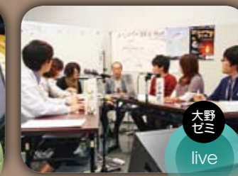
大野ゼミ live LIVE アテナ 5時間半の長丁場に渡る生放送をインターネット上で実施したほか、これまでの白石市内での調査の様々や、秋月ゼミのクレイアニメーション「まごにめ〜しよん」の予告編などのアーカイブ配信も行った。